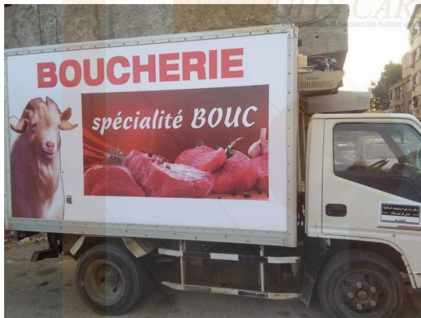
Figure 3 : Illustration du segment de transport de la viande caprine en rapport avec sa chaîne de valeur

viandes. Dans ce travail, nous avons étudié la demande du marché en viande caprine à travers l'analyse des intentions des consommateurs à consommer cette viande. L'objectif de cette étude est de tester des facteurs pouvant influencer et déterminer la consommation de la viande caprine.