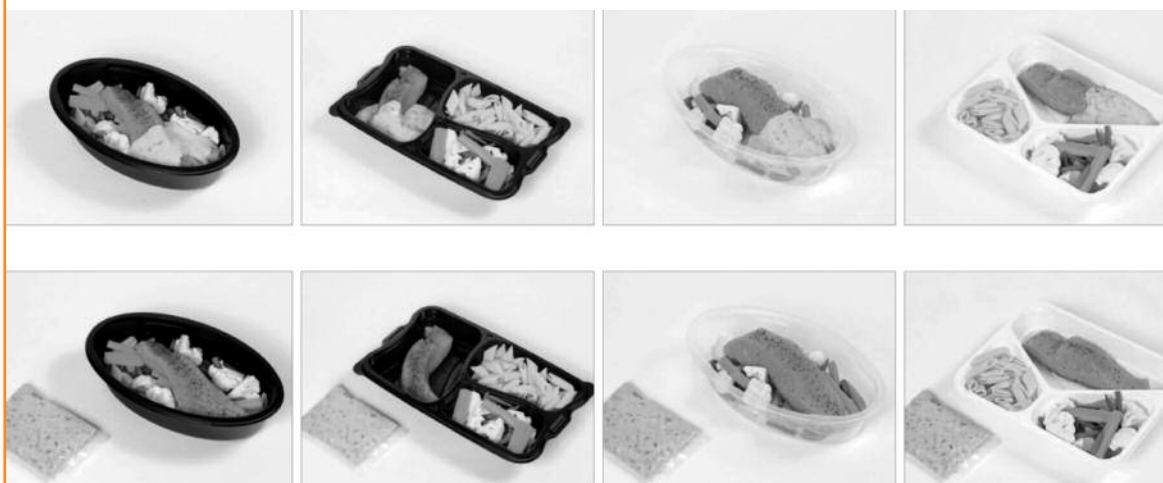
Figure 4 HUIT EMBALLAGES ALTERNATIFS POUR LE PLAT À BASE DE SAUMON FAISANT VARIER LA COULEUR DE LA BARQUETTE, LE NOMBRE DE COMPARTIMENTS ET L'EMPLACEMENT DE LA SAUCE