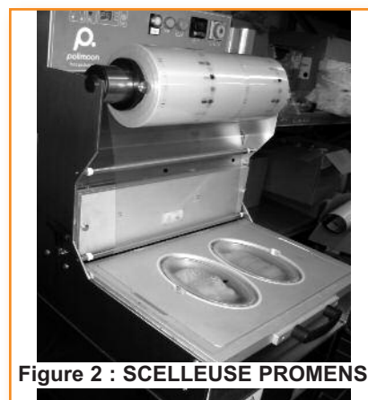
Figure 2 : SCELLEUSE PROMENS