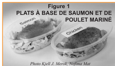
Figure 1 PLATS À BASE DE SAUMON ET DE POULET MARINÉ

Le film supérieur des barquettes peut être équipé de valves vapeur (e.g. Amcor ProtectValve) qui s'ouvrent automatiquement quand le contenu de l'emballage placé au four à micro-ondes se réchauffe. Les valves vapeur permettent un chauffage plus rapide et plus uniforme dans le cas de l'utilisation d'un four à micro-ondes. La dimension et l'épaisseur des différents ingrédients doivent également être adaptées pour rendre le chauffage aussi homogène que possible. Les autres paramètres influençant la qualité et la durée du chauffage sont la forme de la barquette et la quantité de vapeur générée. Le saumon et le poulet ont, dans un four à micro-ondes à puissance 700 watts, des temps de cuisson respectifs d'environ 7 à 8 min.